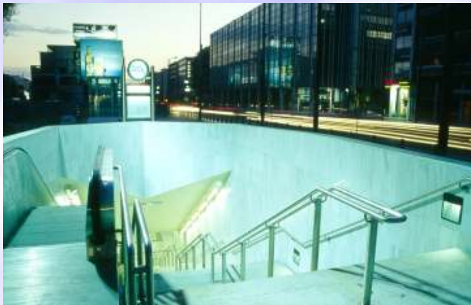
ΣΤΑΘΜΟΣ ΣΥΓΓΡΟΥ-ΦΙΞ Δημιουργία χώρου πρασίνου συνολικής έκτασης περίπου 2 στρεμμάτων