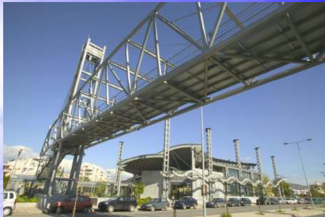
ΣΤΑΘΜΟΣ ΧΑΛΑΝΔΡΙ Πεζογέφυρα