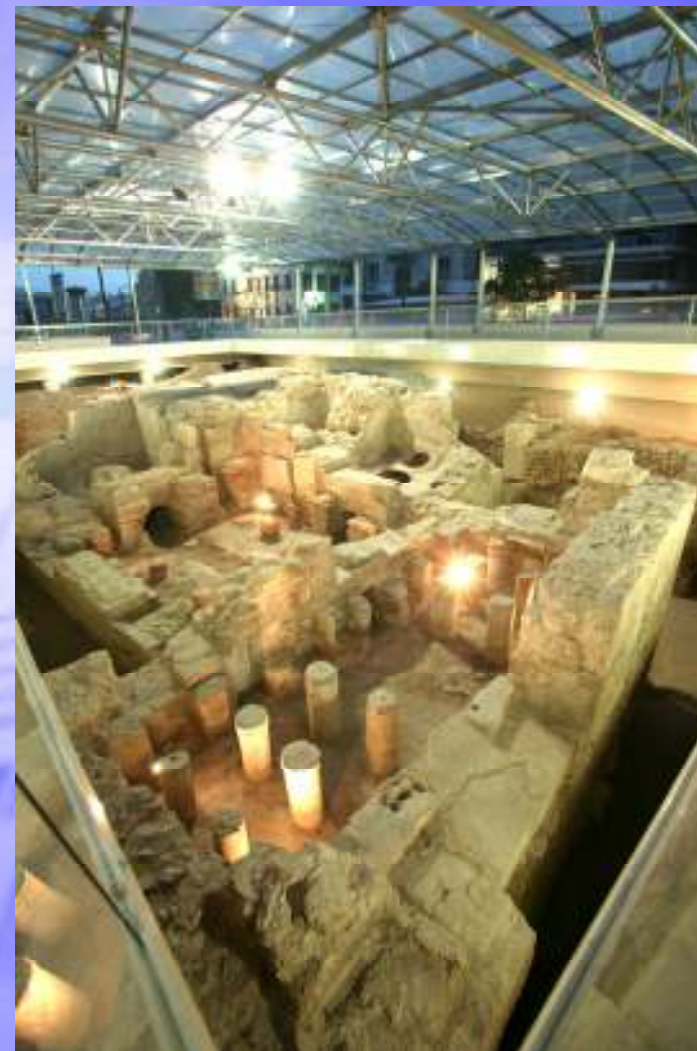
ΦΡΕΑΡ ΑΜΑΛΙΑΣ Ανάδειξη αρχαιοτήτων σε ειδικά διαμορφωμένους χώρους στην πόλη