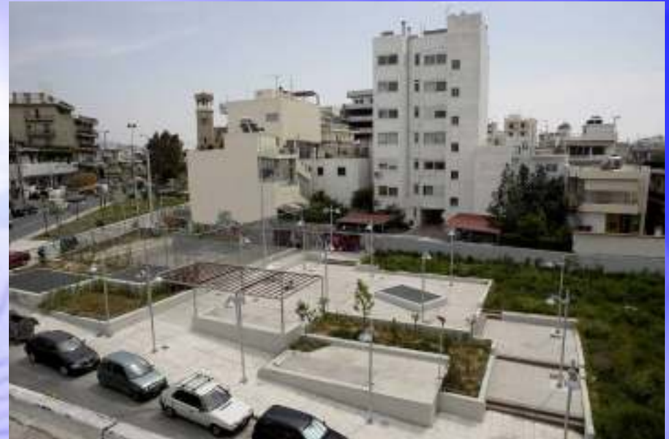
Φρέαρ Βουλιαγμένης (Άγιος Δημήτριος)

Η Αττικό Μετρό Α.Ε. αμέσως μετά την ολοκλήρωση των κατασκευαστικών εργασιών προχωράει στην αισθητική αναβάθμιση των χώρων των Δήμων που είχαν χρησιμοποιηθεί ως εργοτάξια του Μετρό.