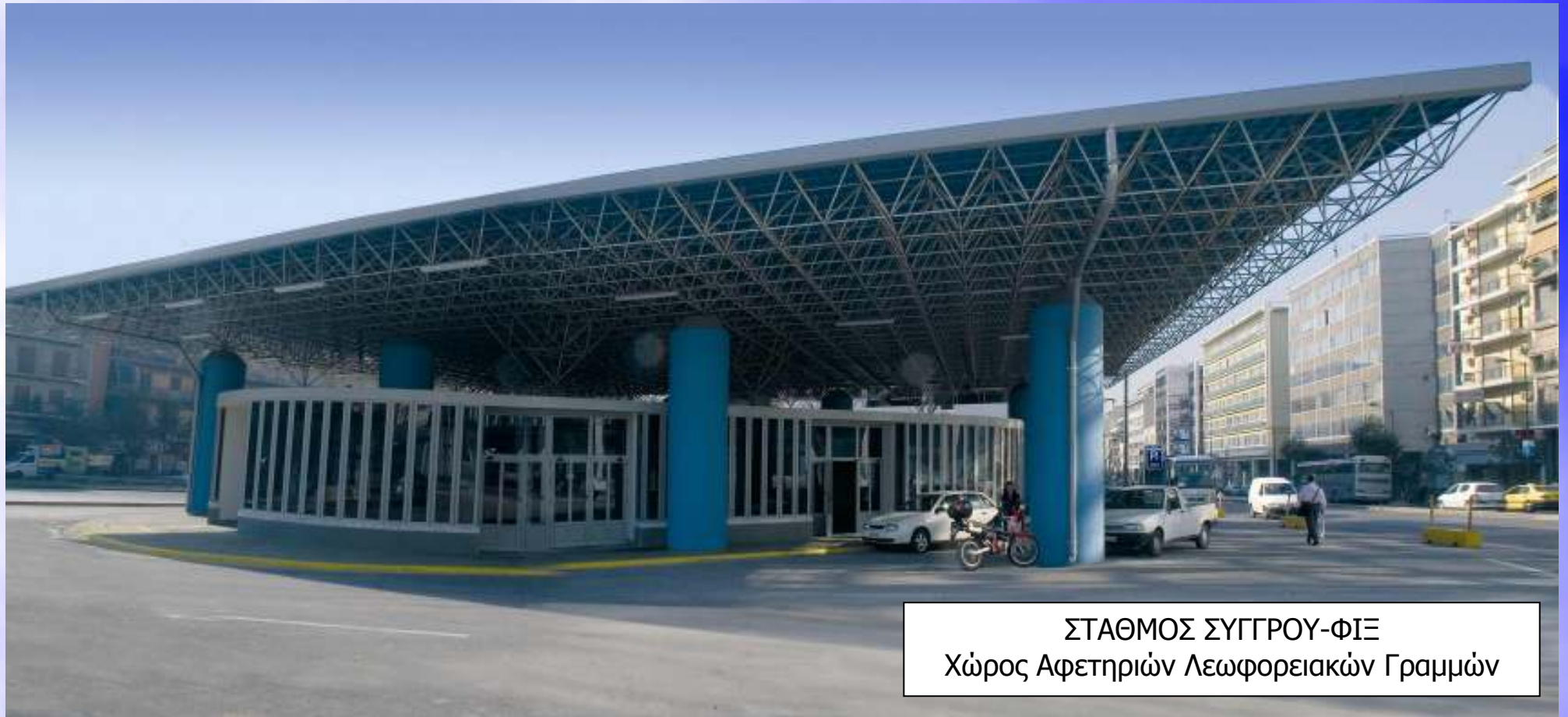
ΣΤΑΘΜΟΣ ΣΥΓΓΡΟΥ-ΦΙΛΕ Χώρος Αφετηριών Λεωφορειακών Γραμμών

Συνολικά σήμερα λειτουργούν στο Μετρό 7 Σταθμοί Μετεπιβίβασης από/προς ΜΜΜ, ενώ υπό κατασκευή βρίσκονται στους Σταθμούς Χαϊδάρη και Νομισματοκοπείο.