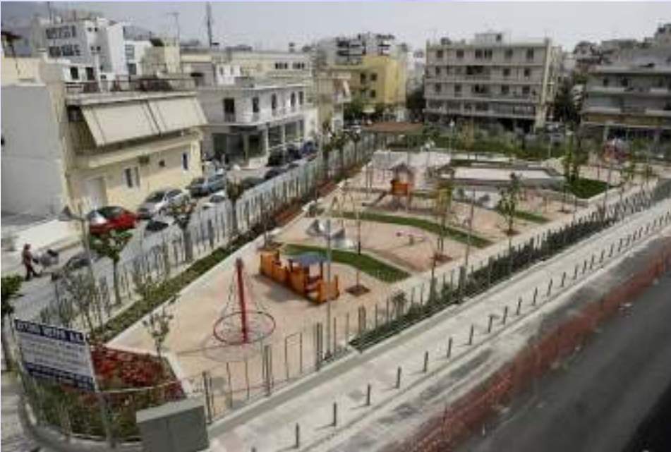
Πλατεία Κάκαρη (Άγιος Δημήτριος)